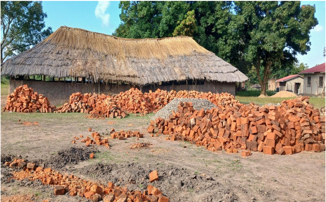
Chuẩn bị nguyên vật liệu để xây dựng nhà nguyện mới cho cộng đoàn