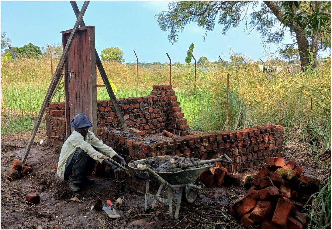
Xây nhà giúp bác làm vườn